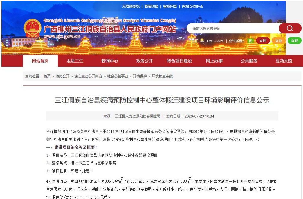
图 1 项目环境影响评价信息第一次公示网络截图