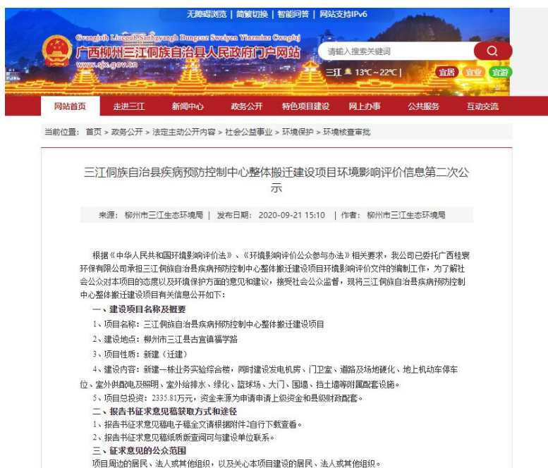
图2 项目环境影响评价信息第二次公示网络截图

广西柳州三江侗族自治县人民政府门户网站第二次公示时间为2020年9月21日，公开期限为十个工作日，公示网址为： http://www.sjx.gov.cn/zwgk/fdzdggk/shgysy/hjbh/hjhjsp/202009/t20200928_2112595.html ，公示截图如下：