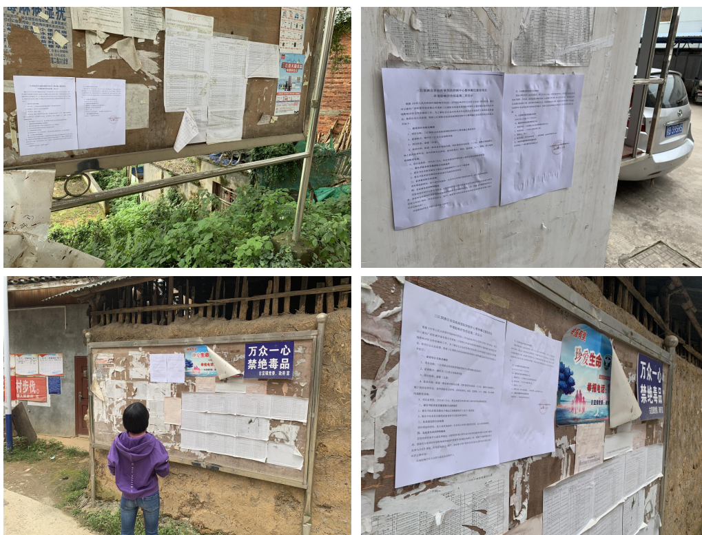
图 5 项目在周边敏感点张贴图片

公示内容主要为项目基本情况、项目征求意见稿的查阅方式、公众提出意见的方式、公示期限等内容。符合《环境影响评价公众参与办法》(生态环境部部令第 4 号)中的相关要求。公示图片张贴情况如下。