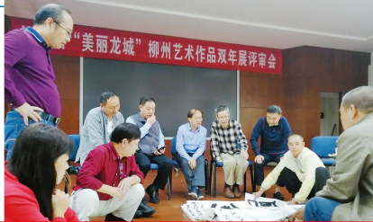
“美丽龙城”柳州艺术双年展评审会现场

日报消息（记者蔡婉君报道）第四届“美丽龙城”柳州艺术双年展（以下简称“双年展”）自正式启动以来，来自区内外外的行业专家学者将评选出书画、摄影、工艺美术等3类优秀作品各15名，入围各30名。本届双年展以“决胜全面小康 决战脱贫攻坚”为主题，共收到书画篆刻类作品210幅、美术类作品191幅。还设立青少年书画展，展出作品2600多件，最终评选出书画、摄影、工艺美术各40件，优秀作品20名。